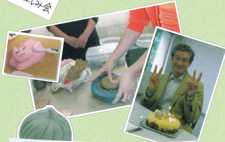
手芸、陶芸、料理...メンバーが先生に