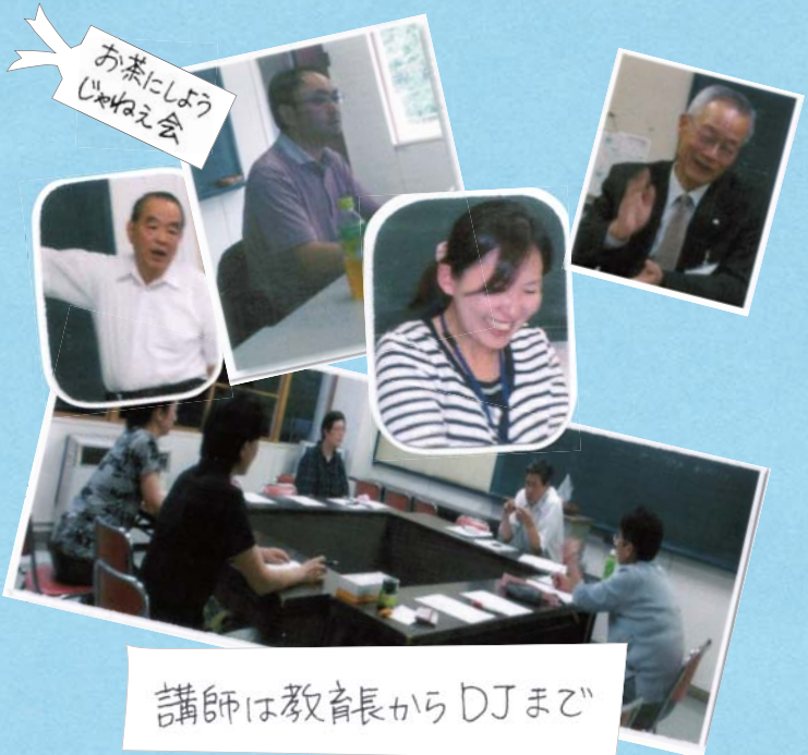
お茶にしようじゃねえ会

市内団体の活動の成果のプレゼンテーションに人形劇で参加。メンバーそれぞれに得意なこと、できることで協力。道前の台本変更にも動じず、自信につながった。また、他団体とのコラボレーションも生まれた。