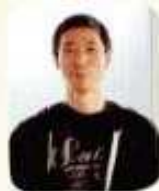
(編集者：関口・美智江)